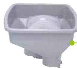
• Násypka CL 50/CL 50 Ultra*

Jako doplněk k 50 existujícím způsobům krájení ovoce a zeleniny, vyzkoušejte ke svému krouhači zeleniny tuto novou jedinečnou funkci.